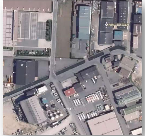
内田工業(株)本社工場